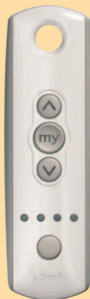
Telis 4 Pure

6 i więcej produktów z napędami radiowymi Somfy