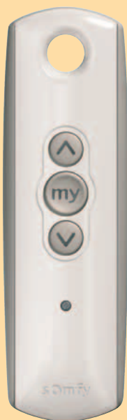
Telis 1 Pure

2-5 produktów z napędami radiowymi Somfy