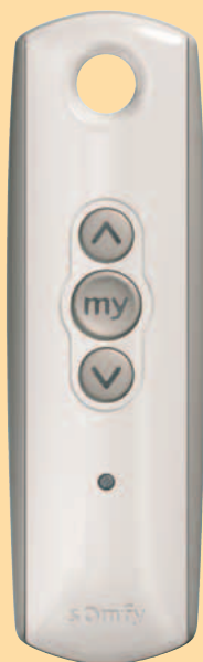
Telis 1 Pure

2-5 produktów z napędami radiowymi Somfy